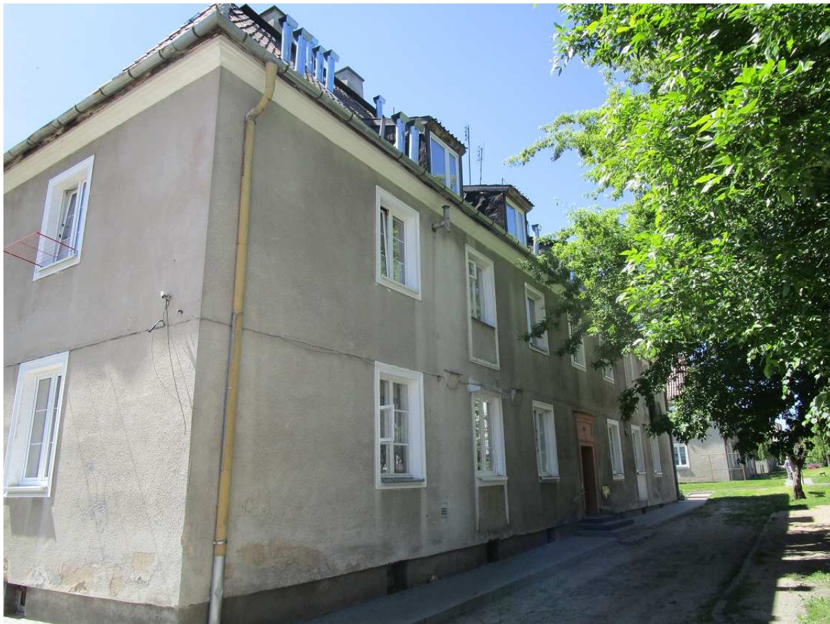
Foto 1 Widok ogólny na elewację

Budynek murowany posiada dwie kondygnacje nadziemne i jedną podziemną oraz poddasze użytkowe. Budynek wzniesiony metodą tradycyjną z cegły ceramicznej w latach 1940 - 44. Dach wielospadowy.