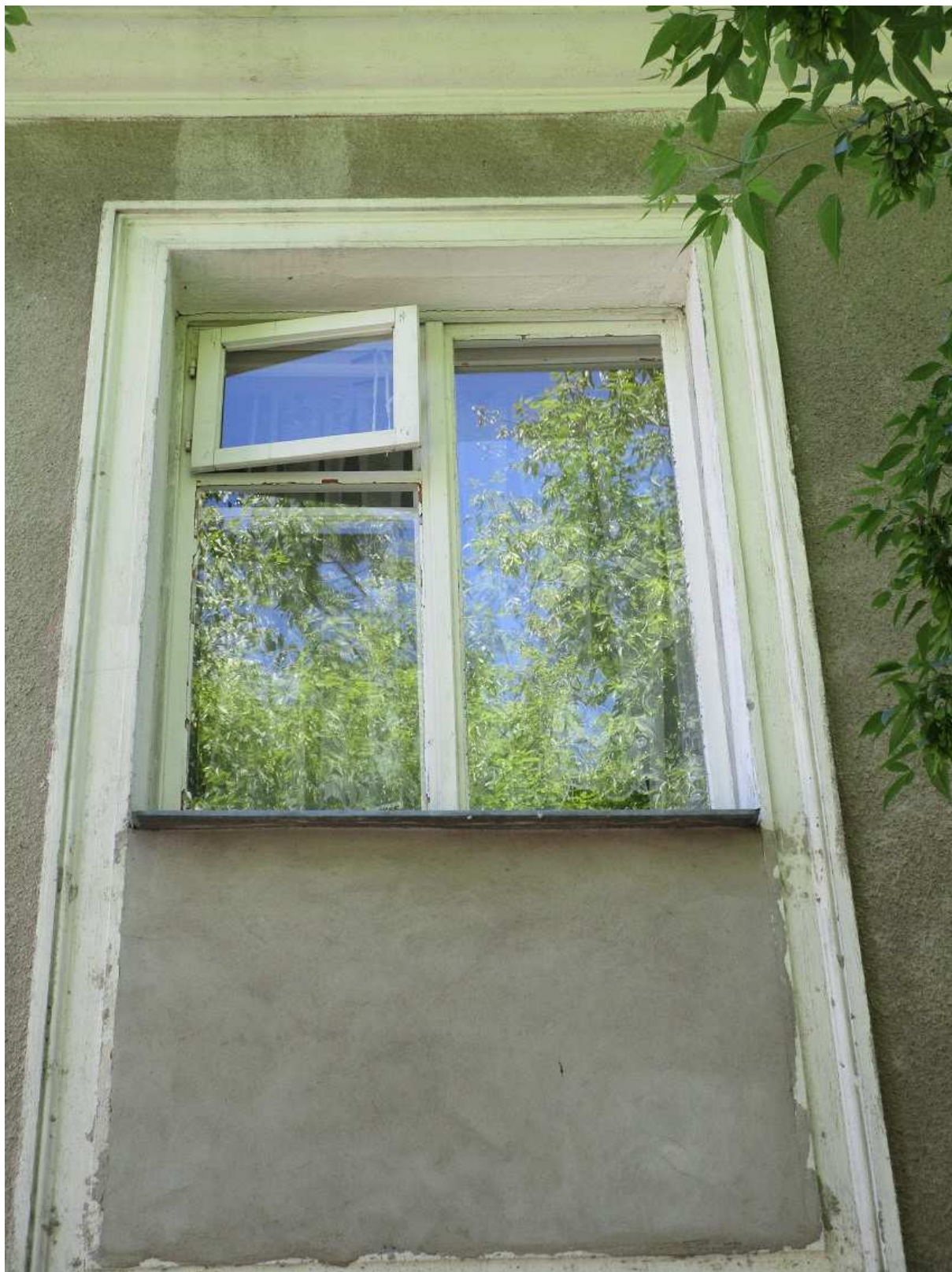
Foto 2 Widok na jedno ze starych okien przeznaczonych do wymiany